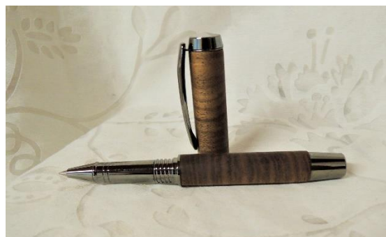
Rollerball Gentleman (Nuss)