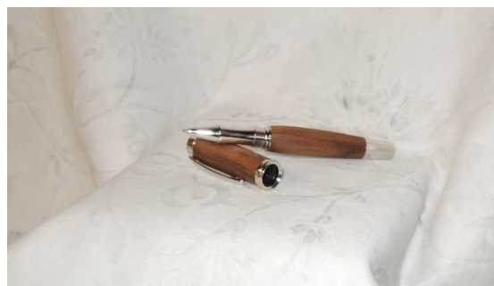
Rollerball Gentleman (Nuss)

In der bipHolzwerkstatt gibt es stilvolle Schreibutensilien. Hier eine Auswahl: